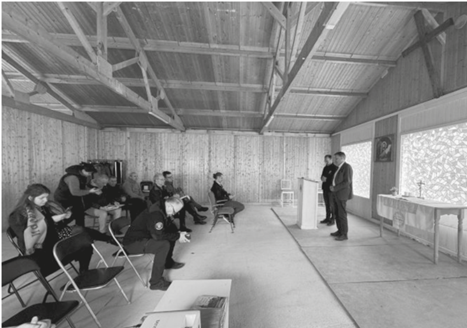
Im Dorf Pohreby im Bezirk Brovary ist der Bau des »Hauses der gegenseitigen Hilfe« im Gange. Hier die provisorische Kapelle.